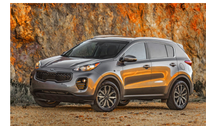
KIA SPORTAGE 2016