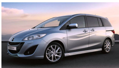
MAZDA 5 2016

En algunas publicaciones de venta de automoviles no aparece la version. Sal de dudas con esta guia comparativa.