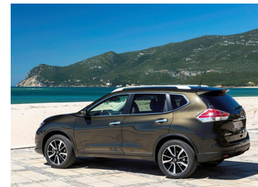
NISSAN X-TRAIL 2016