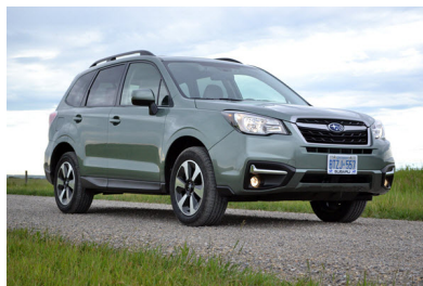
SUBARU FORESTER 2016